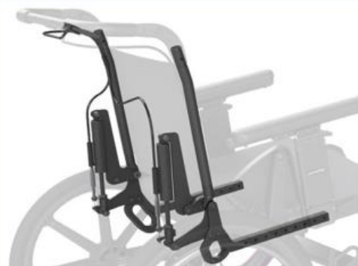
Dossier inclinable | jusqu'à 30° d'inclinaison