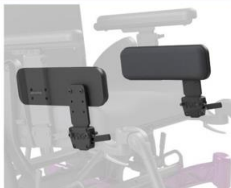
Guides de hanche