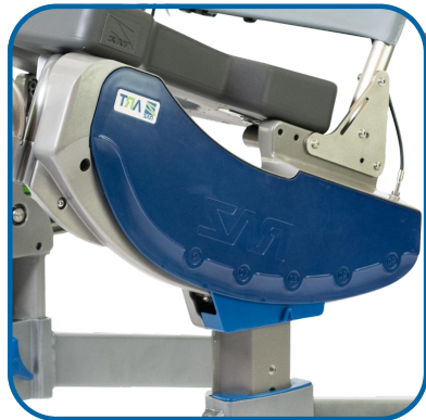
Géométrie d'inclinaison brevetée à double arc

Maintient un emplacement quasi-constant du centre de gravité, ce qui réduit considérablement l'effort d'inclinaison.