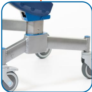
Châssis escamotable Plage haute