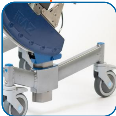
Châssis escamotable Plage basse