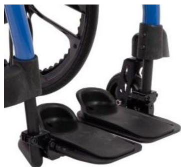
Semelle profilée avec butée