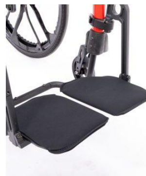
Housse néoprène plaque