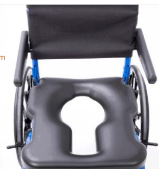
Réglage avant / arrière de 0 à 5 cm. Indépendant du châssis et du dos.