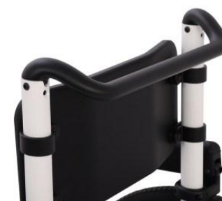
Barre de poussée