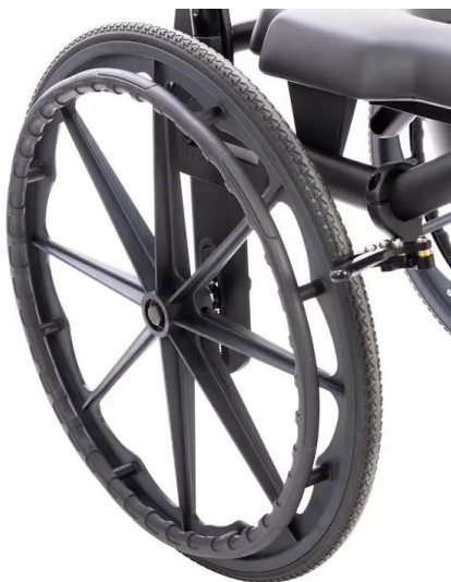
Nylon 3 tailles : 20", 22" et 24" Axe fixe ou axe à encliquetage rapide