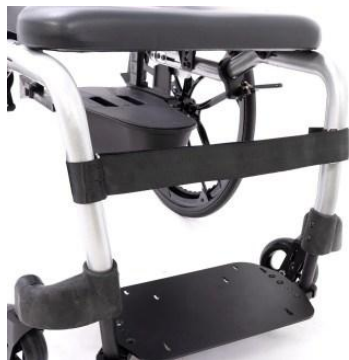
Sangle de mollet pour potence fixe