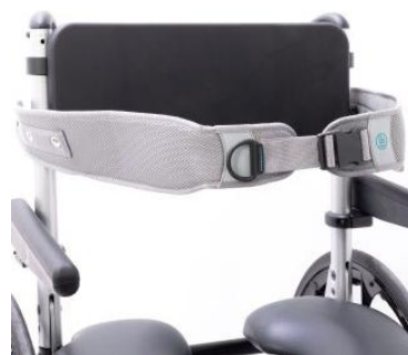
Ceinture de tronc Bodypoint® Existe en xl