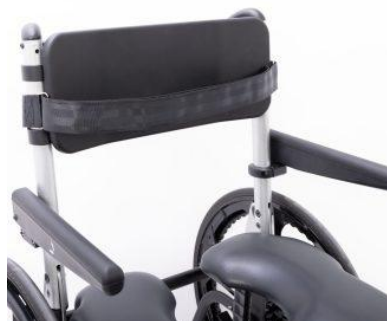
Ceinture de tronc