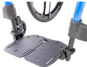
Monobloc, réglable en angle