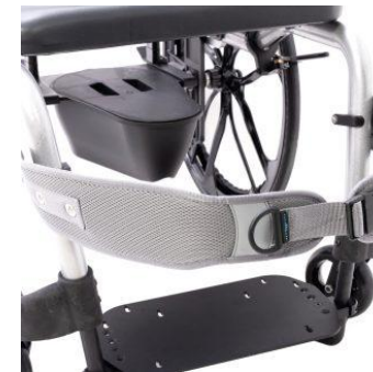
Sangle de genoux Bodypoint®