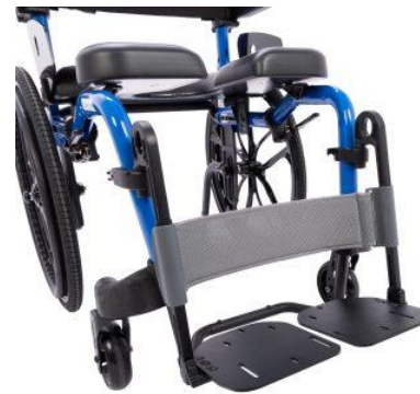
Sangle de mollet Bodypoint® (pour siège 41, 46 et 51 cm)