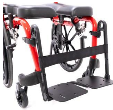
Sangle de mollet pour potence escamotable