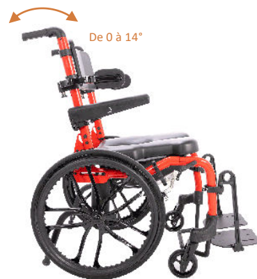
Dossier inclinable (à 0, 7, 14°) et pliable