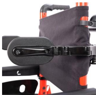
Cale tronc pivotant et réglable