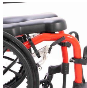
A poussée : poignée courte