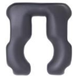
Ouverture à l'arrière