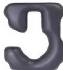
Ouverture côté gauche