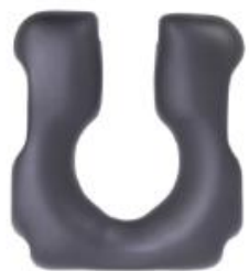
Ouverture à l'avant