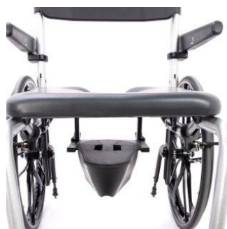
Profondeur allant de 2,5 cm à 12,5 cm (incrémentation de 2,5 cm)