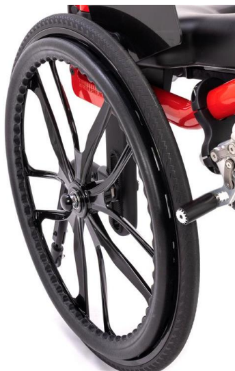
Magnésium 2 tailles : 22" et 24" Axe fixe ou axe à encliquetage rapide Main courante en aluminium ou main courante ergonomique Pneu bandage cranté ou pneu bandage lisse