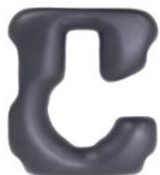
Ouverture côté droit