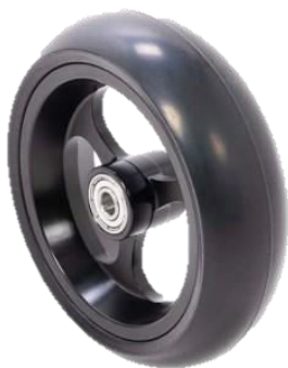
Deluxe aluminium 5"