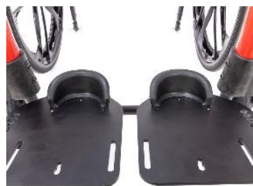
Butée de talon