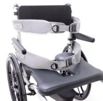
Ceinture de tronc et ceinture ventrale Bodypoint®