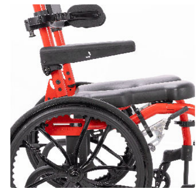
Inclinaison réglable de 4 crans De 0 à 3,8 cm