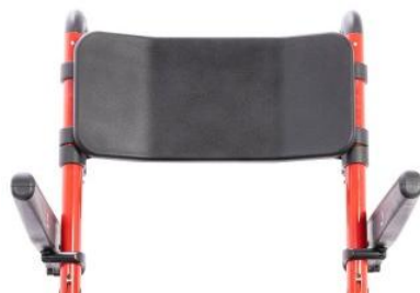
Dossier rigide en mousse