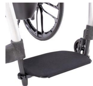
Housse néoprène bloc